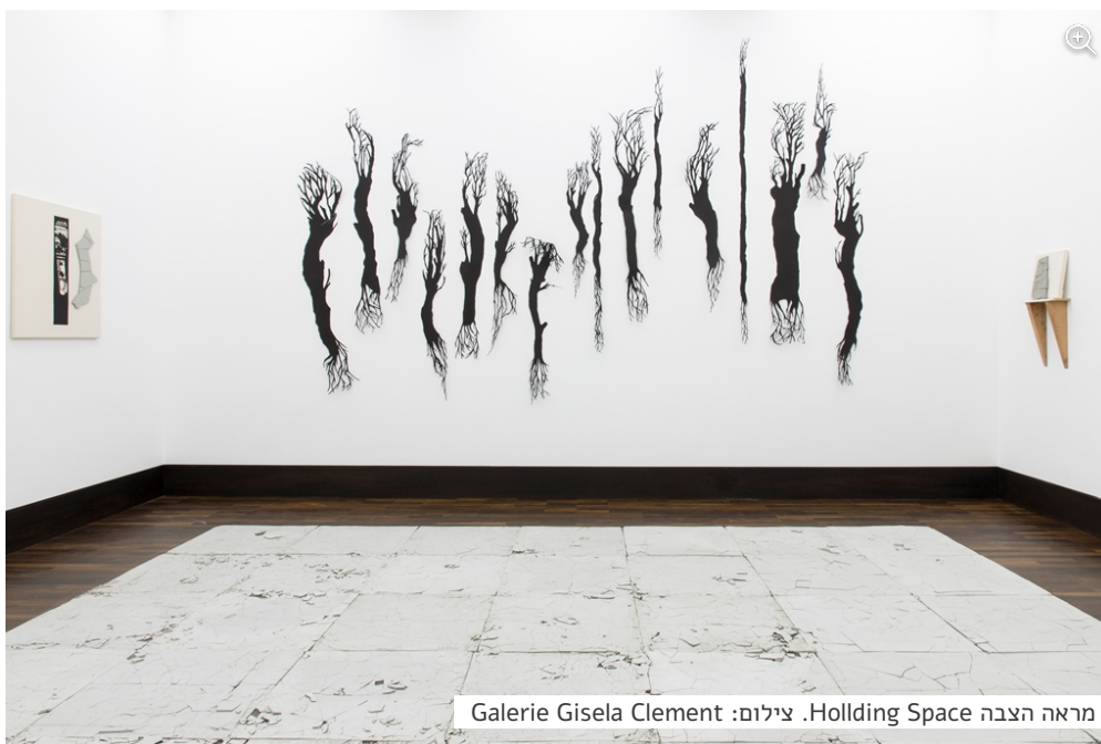
מראה הצבה Holding Space.