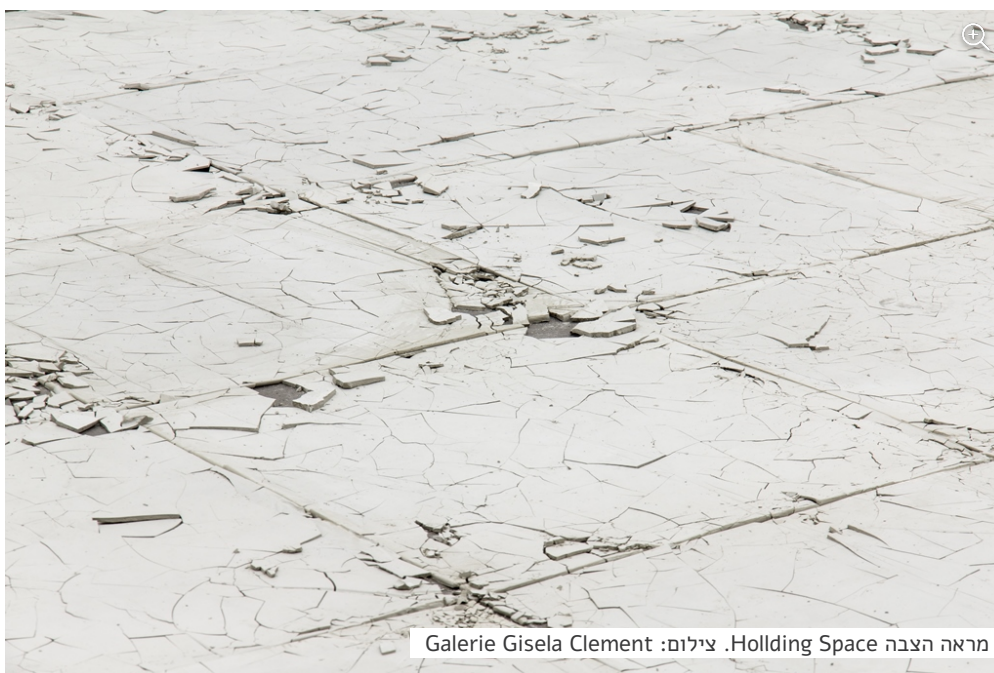
מראה הצבה Holding Space.

שכבת המלט הדקה הזו נסדקת לאט לאט, עם משקל הצופים כשהם מסתובבים בחלל ודורכים עליה. הרצפה הנשברת מדגישה את מושג הזמניות וכיצד השינוי המתמיד משפיע על הדרך שבה אנחנו קוראים את הנרטיב שלנו. השבירה המתמשכת של הרצפה מאפשרת התבוננות ליטרלית בשינוי, מתוך הבנה עמוקה שזה הדבר הקבוע היחיד בחיינו. יותר משייכות, בית ואדמה, כולנו נמצאים בתנועה מתמדת בזמן ומקום.